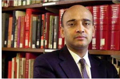
Kwame Anthony Appiah

Die riesigen Hallen eines Flughafens sind einer der besonders luziden Räume, die die Dokumentation bereist. Kaum ein Ort nimmt sich in seiner pragmatischen Glashallenästhetik so sehr zurück wie ein Flughafenterminal und versinnbildlicht doch gleichzeitig so prägnant unsere globalisierte Welt. Letztere wird dann auch, inmitten wuselnder Reisender, zum Thema des Moralphilosophen Kwame Anthony Appiah. „Allein am Flughafen begegnen wir so vielen Menschen auf einmal, wie unsere Vorfahren in ihrem ganzen Leben nicht gesehen haben“, sagt Appiah. Es sei eine der bedeutendsten Herausforderungen für unser modernes Leben, darüber nachzudenken, wie wir Menschen untereinander weltweit gegenseitige Verantwortung übernehmen können.