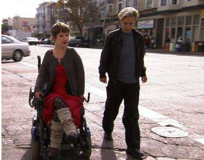
Sunaura Taylor&Judith Butler

Körper erinnern uns Menschen daran, dass unsere Körper altern und sterblich sind.“ Dann verliert die Kamera die beiden aus dem Blickfeld.